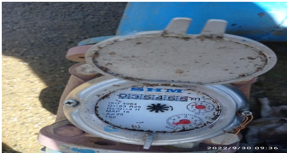
Flow Meter Akhir Menunjuk 3545

Untuk Jumlah Pemakaian dari Tanggal 1 Agustus 2022 sampai 30 September 2022 Bejumlah