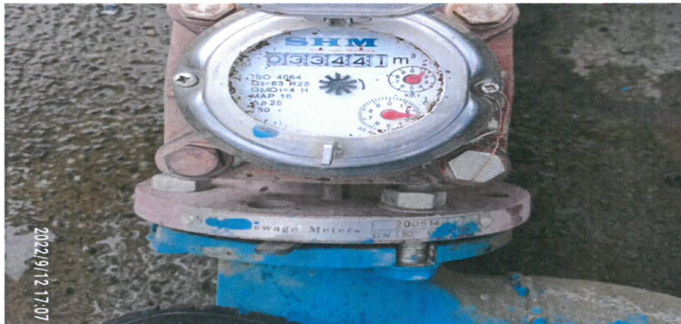
Flow Meter Akhir Menunjuk 3344

Untuk Jumlah Hari dari tanggal 31 Agustus 2022 sampai 12 September 2022 terdapat 2 Hari Minggu , Yang pada Saat Hari Minggu Pompa Tidak Beroperasional Sehingga Jumlah Total Hari adalah 10 Hari